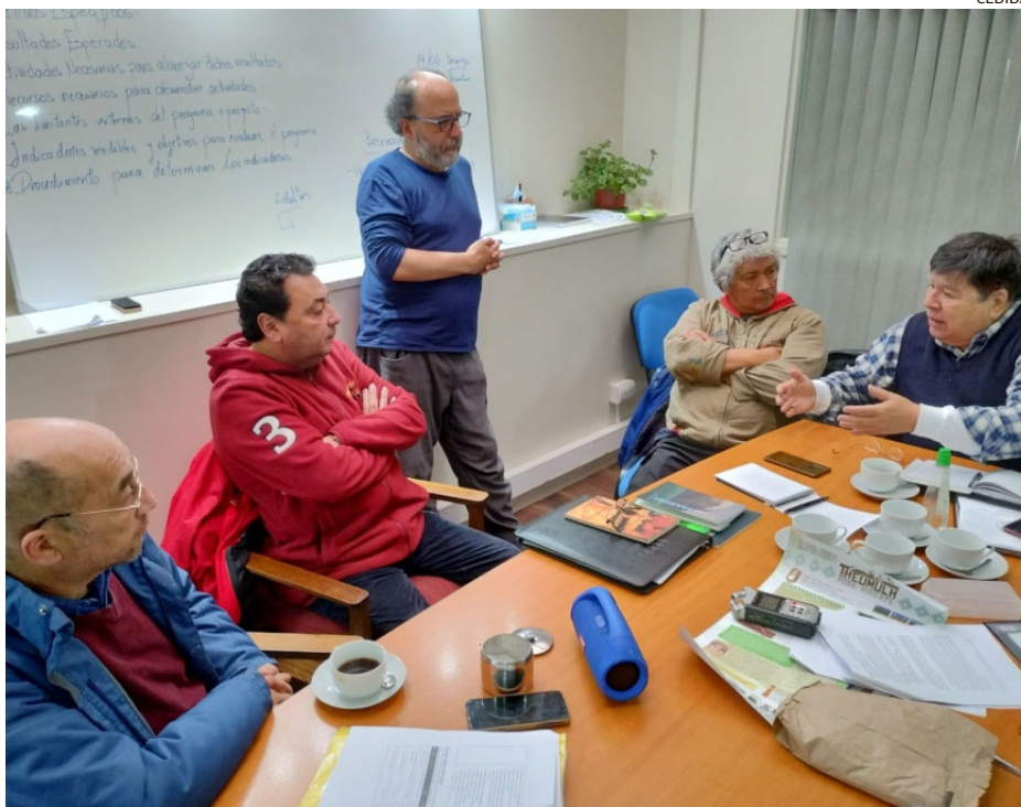
SIETE SON LOS ESPACIOS QUE TENDRÁN SU ENCARGADO DE EXPRESIÓN ARTÍSTICA U OFICIO.